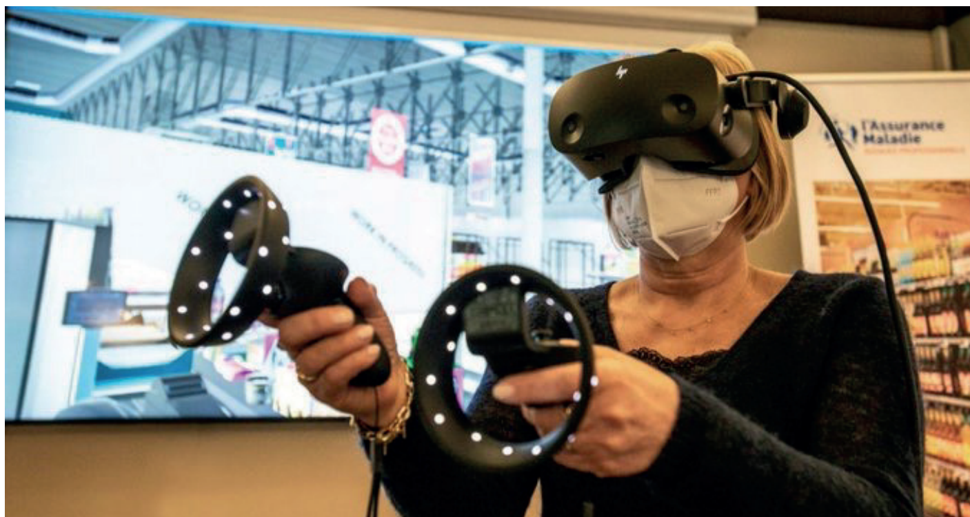
Action de prévention construite en réalité virtuelle : extrait du diaporama de l'AST Moselle-Est

présentées : le Service de Creutzwald a décrit le recours par les SPSTI du Grand Est à la réalité virtuelle dans les entreprises de la grande distribution, l'AH133 a partagé l'expérience de plusieurs SPSTI de Nouvelle Aquitaine dans l'utilisation d'un escape game pour mieux connaître le risque chimique, et enfin, le Service de Dignes-les-Bains a présenté l'outil qu'il utilise avec d'autres SPSTI pour réaliser la fiche d'entreprise et faciliter ensuite la réalisation du document unique. Ce sujet a aussi bénéficié d'une réflexion sur la promotion de la santé et la littéracie en santé au travail par le Professeur RASCLES Professeur en psychologie de la santé à Bordeaux.