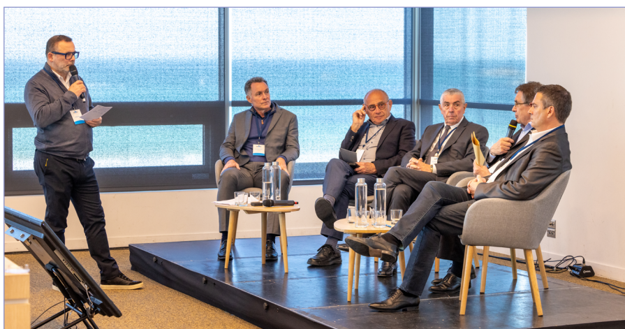
Interventions lors d'une des tables rondes de Présidents de régions

Presanse.fr > Actualités > Événements > Journée d'étude à Saint-Malo, support de présentation disponible