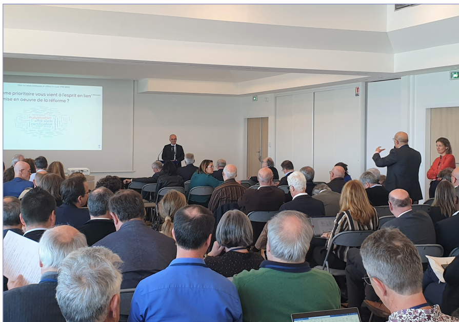
Les participants votant en direct sur les priorisations de travail des grands enjeux de la réforme.

A noter que chacune de ces tables rondes a donné lieu à une séquence interactive, permettant aux participants de voter quant aux priorisations relatives aux actions suggérées, et de voir s'afficher en direct les résultats à l'écran dans la salle.