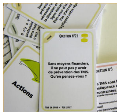
Figure 2 : Exemple de carte de TEAM'Prev TMS

L'Agemetra, Association de la loi 1901 à but non lucratif, propose le jeu et la formation aux ergonomes et préventeurs des SPSTI à prix coutant. L'Agemetra envisage, dans un second temps, de proposer ce jeu aux SPSTI du réseau Présanse de toute la France.