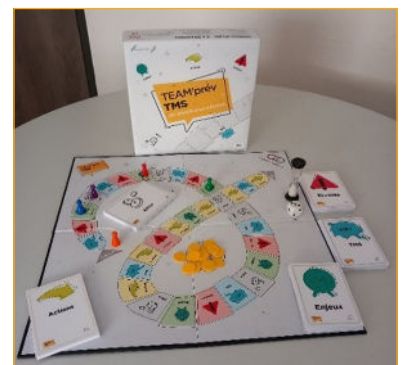
Figure 1 : jeu TEAM'Prev TMS

TEAM'Prev TMS répond globalement à un besoin d'accompagnement méthodologique plus personnalisé, afin d'inscrire la sensibilisation comme une étape et non comme une finalité en soi.