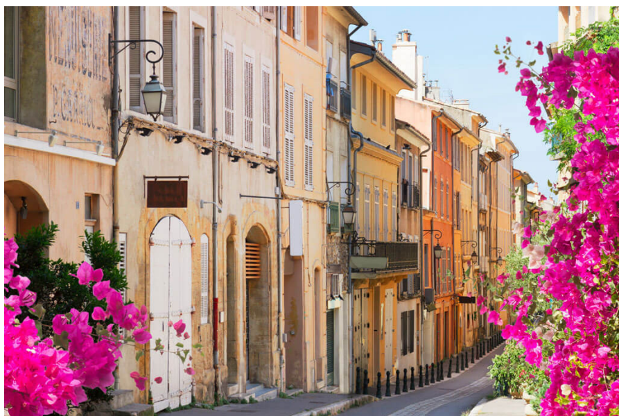
Aix-en-Provence, ville d'accueil de l'AG 2024.

Pour toute information complémentaire, les Services peuvent contacter l'office du tourisme d'Aix-en-Provence par mail. ■