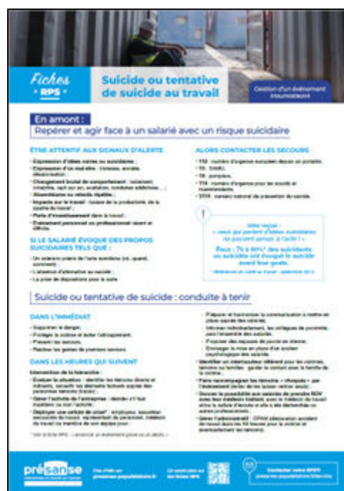
Illustration n°2 : Exemple de fiche pratique.