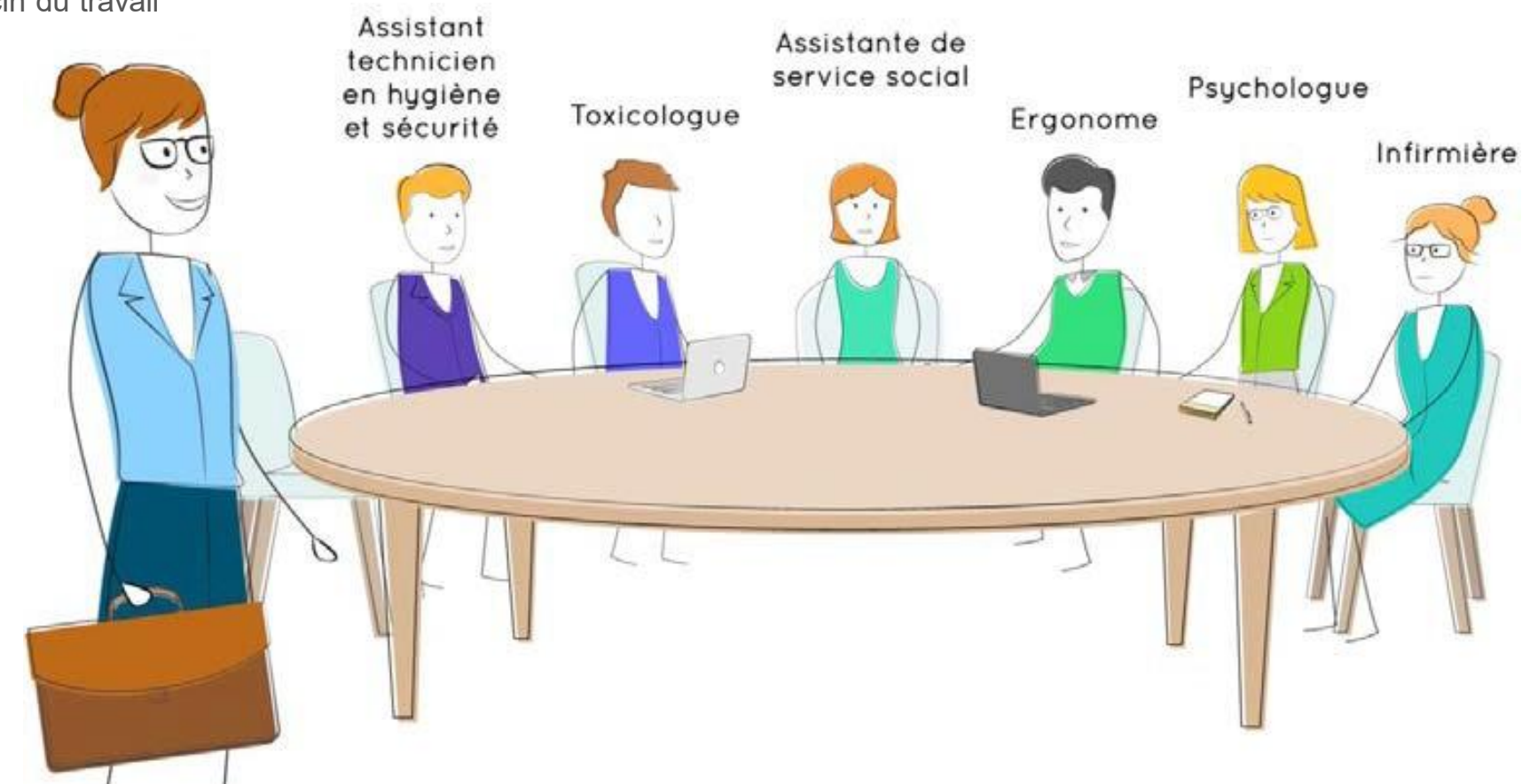
Médecin du travail