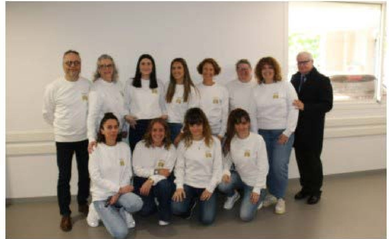
Les équipes du SMTI 82 mobilisées pour la sensibilisation à l'endométriose