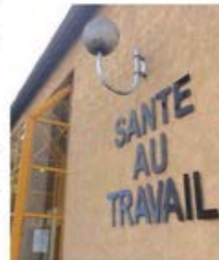
L'événement est consacré aux troubles musculo-squelettiques. Illustration Samuel Tribollet

Cet événement vise à sensibiliser les acteurs du monde du travail et leurs salariés pour leur donner des clés et notamment agir efficacement sur les troubles musculo-squelettiques (TMS).