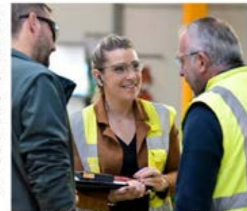
Au-delà du simple suivi médical, les Services de prévention et de santé au travail déploient une expertise pluridisciplinaire pour accompagner les entreprises.

partie de l'offre sociale, les services proposent une expertise pluridisciplinaire complète incluant ergonomes, psychologues et techniciens en prévention. "Beaucoup d'entreprises, notamment les TPE-PME, adhèrent parfois par obligation sans savoir exactement à quels services elles ont droit", explique la déléguée régionale. Elle rappelle que la prévention est un investissement stratégique et un levier de performance : un poste bien aménagé signifie moins d'arrêts de travail, une réduction de l'usure professionnelle et un gain de productivité immédiat.